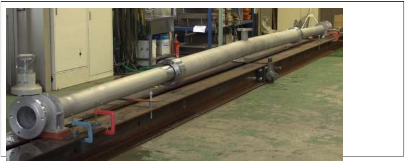
【NSフリースパン水管橋®の全体写真】