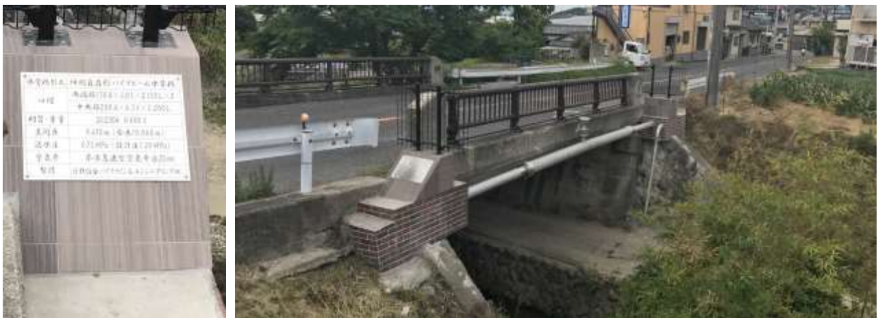
【太子町山田橋水管橋架替工事での設置後の完成写真】